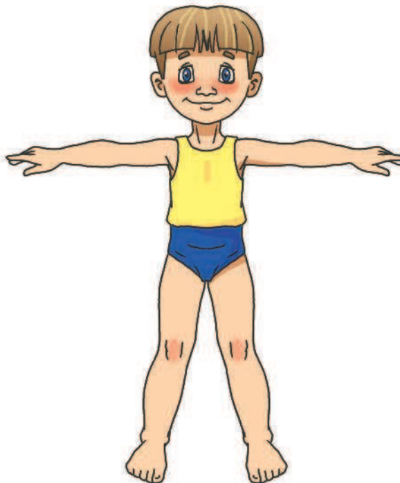
Hands up, to the sides.