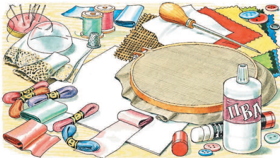
Работа с тканью