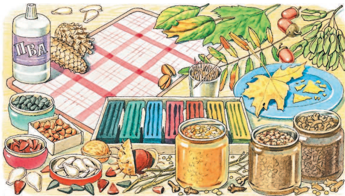
Работа с природными материалами