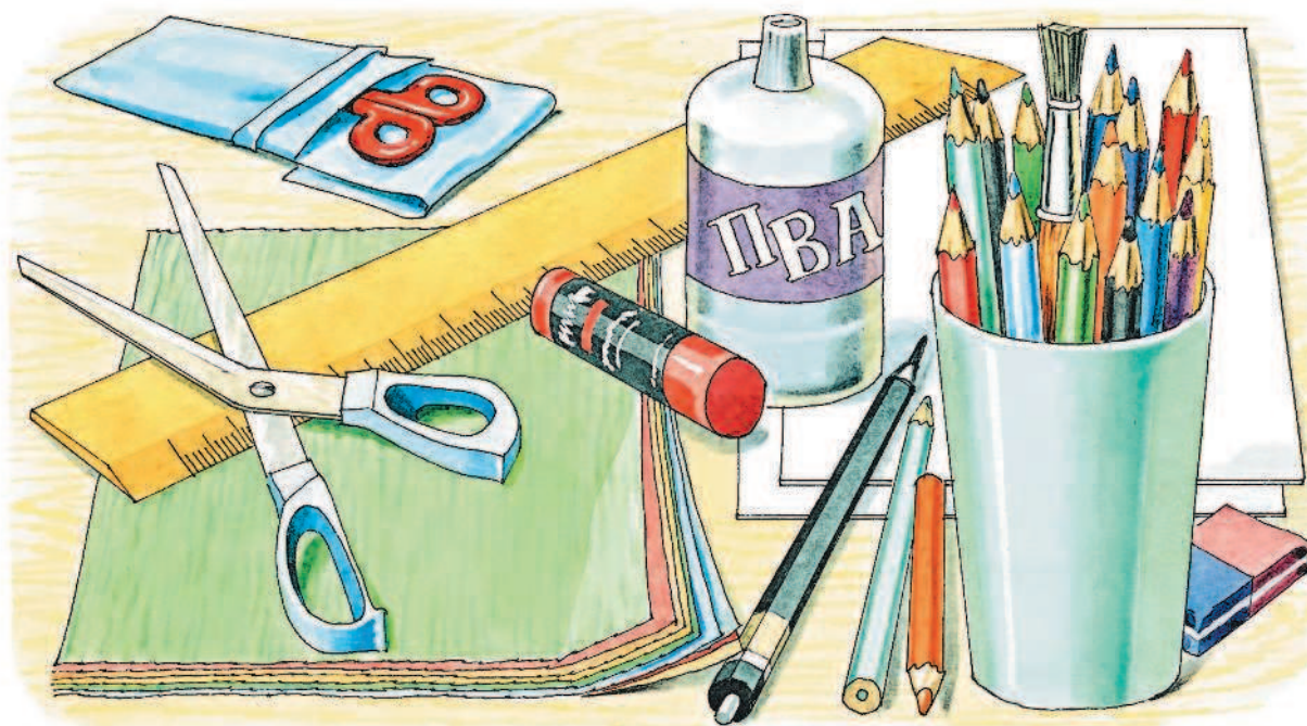
Работа с бумагой