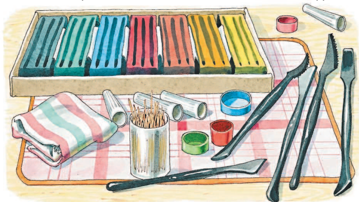
Работа с пластилином

Чтобы научиться работать с разными материалами, внимательно изучай схемы изготовления поделок и инструкции.