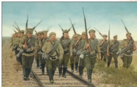
Русские солдаты движутся к фронту. Французская открытка времён Первой мировой войны

Мобилизационная кампания в России из-за большой протяжённости страны и недостаточно развитой транспортной сети разворачивалась медленно. С военно-стратегической точки зрения русским войскам целесообразно было бы наступать на юго-западном направлении против Австро-Венгрии. Но успехи германских войск во Франции и её обращение за помощью к России подтолкнули к решению начать с вторжения в Восточную Пруссию.