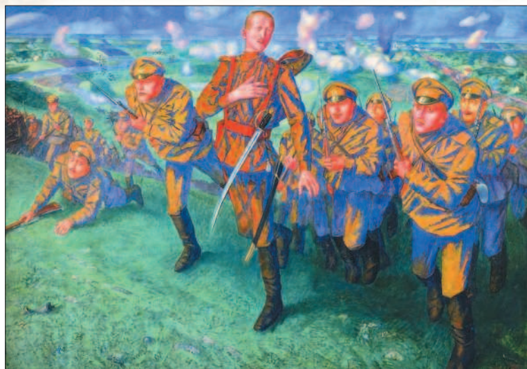
На линии огня. Художник К. С. Петров-Водкин

? Что хотел подчеркнуть художник? Какие чувства вызывает у вас эта картина?