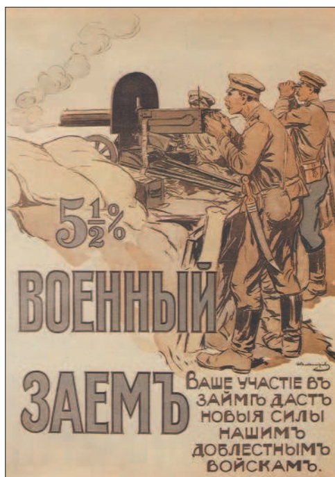
Плакат с призывом подписываться на военный заём

Но даже с помощью общественности не удавалось создать крепкий промышленный тыл, организовать полноценное обеспечение армии и мирного населения. Страна нуждалась в топливе, металле, продовольствии. Наиболее критическое положение сложилось на железнодорожном транспорте. Несмотря на успехи в железнодорожном строительстве,