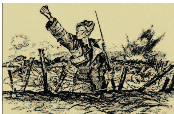
Агитационный плакат, посвящённый Первой мировой войне (слева), и популярный рисунок В. Щеглова «Проклятие империалистической войне» (справа)