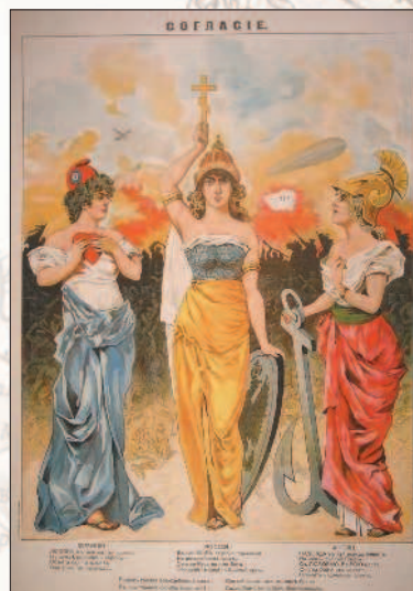
«Согласие. Франция, Россия, Англия». Плакат (1914 г.)

Германия укрепляла свои позиции в Турции и Болгарии, Австро-Венгрия искала по-