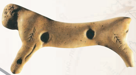
Магический амулет, помогавший удачной охоте. 20 тыс. лет до н. э.