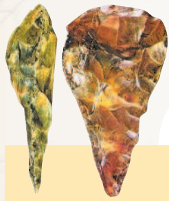
Каменные рубила первобытного человека