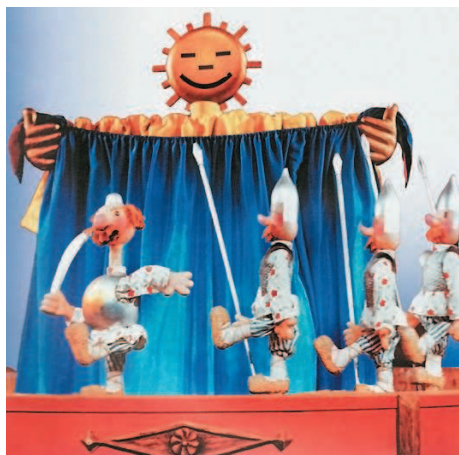
Сцена из спектакля «По щучьему велению». Театр кукол им. С. В. Образцова. Москва

(экранных) обусловлена единством снимаемого, изображаемого и воспринимаемого пространства.