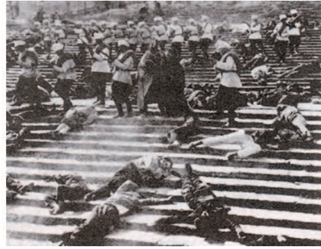
Сцена расстрела на Потёмкинской лестнице. Кадры из фильма «Броненосец «Потёмкин». 1925 г. Режиссёр С. М. Эйзенштейн

ветствии с законом театральности МХТ: «скучно не то, что длинно, а то, что скучно». Так что в длинной сцене «напряжение театра было непрерывно потрясающим, и время не казалось длинным. А короткая сцена была такой же сильной — и не казалась короткой».