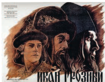
Кадр из фильма с совмещением крупного и общего плана