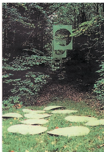
Перформанс «Интервалы». Группа «Коллективные действия». 1988 г.