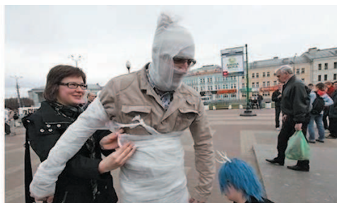
Хеппенинг во время первомайской демонстрации. 2011 г.

тели активно вовлекают случайную публику в загадочные, а порой алогичные действия. В их распоряжении разнообразный реквизит, состоящий из бывших в употреблении вещей, яркие нелепые костюмы, подчёркивающие неодушевлённость персонажей. Подобная игра носит импровизационный характер, каждый участник может в любой момент выйти из неё.