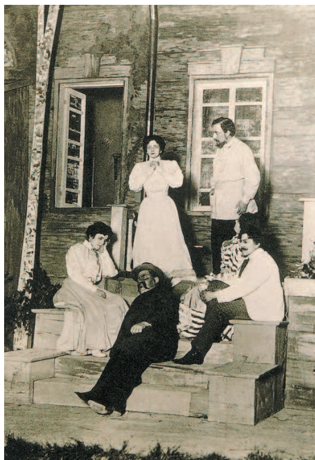
Сцена из спектакля «Дети солнца» по пьесе М. Горького. Драматический театр В. Ф. Комиссаржевской. Петербург, 1905 г.

Синтетическая природа пространственно-временных искусств имеет ещё одну характерную особенность: они в значительной мере способны активизировать роль публики. Подобное можно наблюдать во время народных праздников, шествий и карнавалов, различных ритуальных действий. В последние годы стал особенно популярен хэппенинг (от англ. happening — происходящее; непреднамеренное происшествие или событие) — представление для публики, в ходе которого исполнители обычно взаимодействуют с аудиторией, используют элементы живописи, театрального спектакля и танца. Обычно такие синтетические действия разыгрываются во дворах, залах больших магазинов, на вокзалах, улицах и площадях, а иногда за городом, на лоне природы. Получив задание от режиссёра, исполни-