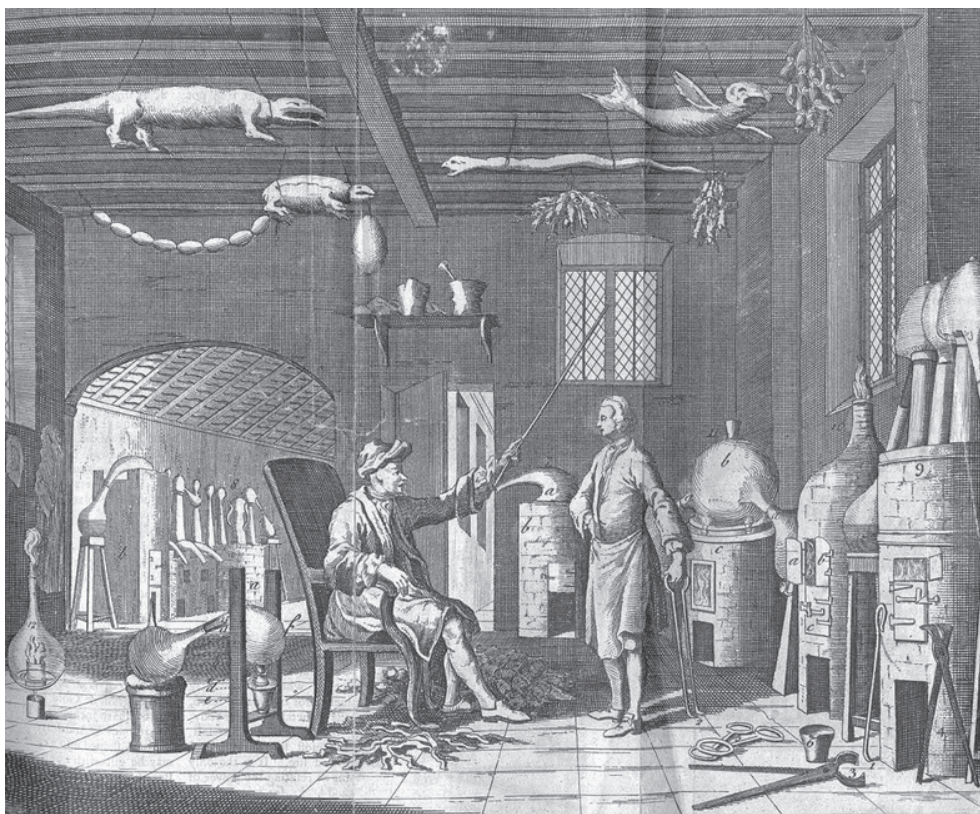
Рис. 4. Алхимическая лаборатория

В XVIII в. благодаря работам А. Л. Лавуазье (1743—1794) и М. В. Ломоносова (1711—1765), открывших закон сохранения массы