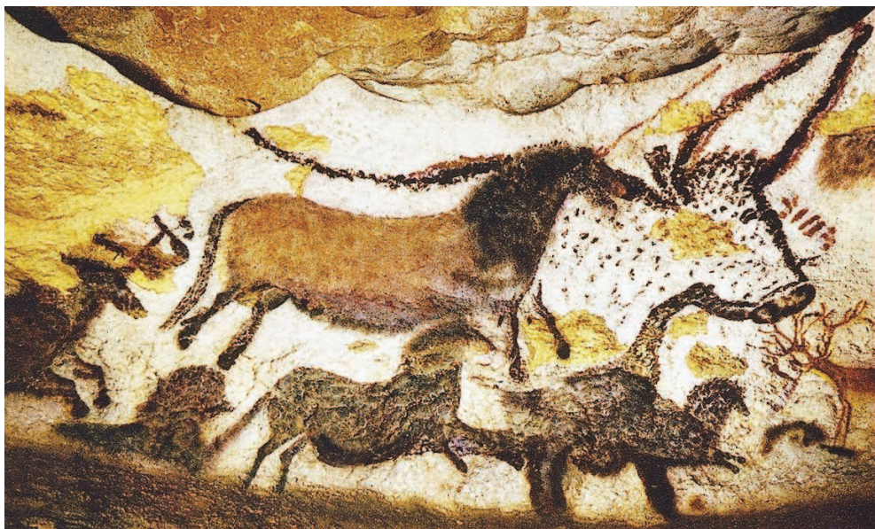
Рис. 1. Некоторые рисунки точно передают пропорции животных (пещера Шове, Франция). Ок. 32 тыс. лет до н. э.

посева, полива и сбора урожая. Зависимость земледелия и скотоводства от разливов рек и других периодических природных явлений привела к необходимости создания календаря . Поэтому в эпоху неолита раньше других наук о природе стала развиваться астрономия.