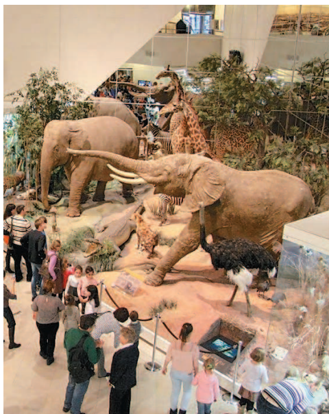
Рис. 5. Экспозиция Дарвиновского музея