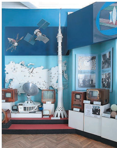
Рис. 6. Экспозиция политехнического музея

стран работают музеи естествознания, научно-технические музеи и планетарии.