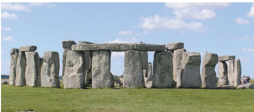
Рис. 2. Древняя обсерватория — Стоунхендж

Астрономия — это наука о движении, строении, происхождении и развитии небесных тел и их систем.