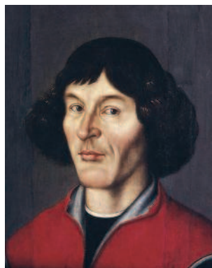
Николай Коперник. Портрет из Фромборкского замка работы неизвестного художника XVI в.

» Вспомните , в чём сущность гелиоцентрической системы. Какую систему мира она опровергала?