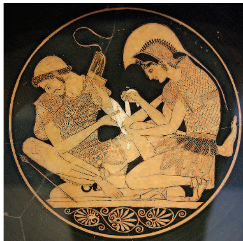
Рис. 3. Ахиллес, перевязывающий рану Патроклу. Роспись на дне чаши. Ок. 500 г. до н. э.

Первые путешествия — во II тысячелетии до нашей эры