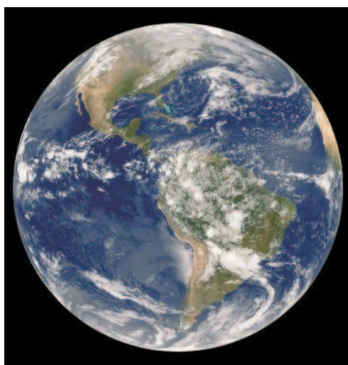
Планета Земля из космоса