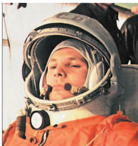
Первый космонавт Юрий Алексеевич Гагарин

Планета Земля удивительно красива. Первый космонавт мира, наш с вами соотечественник Юрий Алексеевич Гагарин, вернувшись из полёта, сказал: «Облетев Землю в корабле-спутнике, я увидел, как прекрасна наша планета. Люди, будем хранить и приумножать эту красоту, а не разрушать её!»