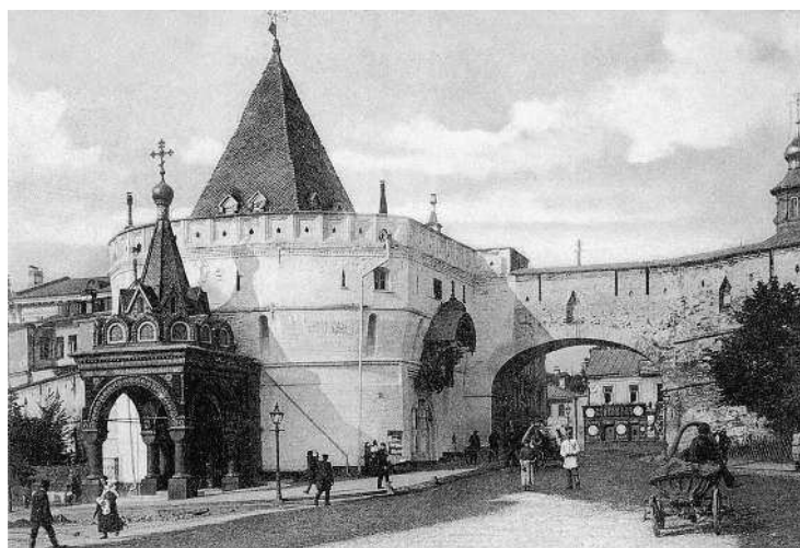
Варв́арские ворота Китай-города на рубеже XIX—XX вв.