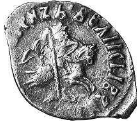
Монеты XV—XVI вв.