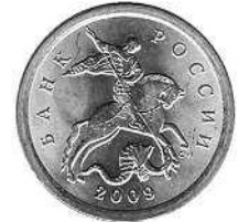
Монета Сбербанка России