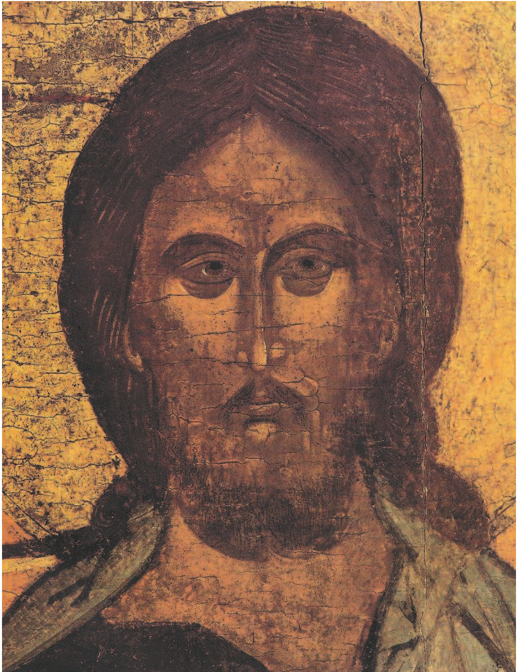
Спас Каргопольский Северный