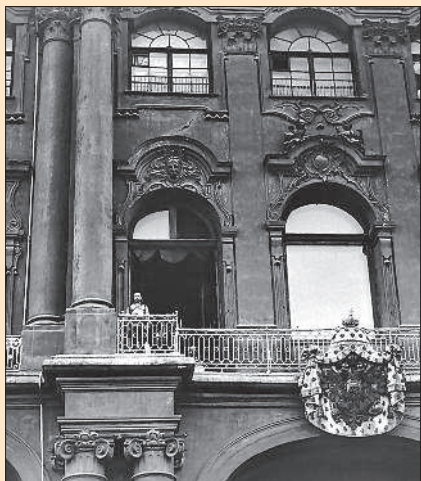
Николай II на балконе Зимнего дворца перед провозглашением Манифеста о вступлении в войну. Санкт-Петербург. 20 июля 1914 г.

С самого начала войны в России провозгласили Германской, Великой, Второй Отечественной. Патриотические настроения в обществе ободрили царя. Казалось, в народе наступило единодушие. 20 июля (2 августа) 1914 г. в Петербурге на Дворцовой площади прошла манифестация в поддержку войны под лозунгами солидарности со славянскими народами и защиты их от тевтонской агрессии. А когда император и императрица вышли на балкон Зимнего дворца, десятки тысяч людей дружно опустились на колени. Манифестанты с воодушевлением спели гимн «Боже, Царя храни!». В тот же день вышел царский Манифест, в котором подчёркивались традиционное миролюбие России и агрессивность Германии. Документ призывал всех россиян забыть внутренние распри, «оградить честь,