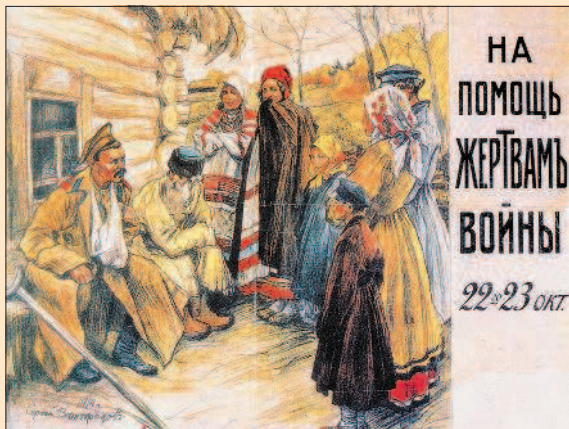
С.А. Виноградов. Плакат. 1914 г.

множество других частных общественных объединений. Земский союз и Союз городов занимались санитарным делом, заготовками и поставками для армии продовольствия, обмундирования и снаряжения. Их деятельность координировал Главный по снабжению армии комитет земского и городского союзов (Земгор) во главе с князем Г.Е. Львовым.