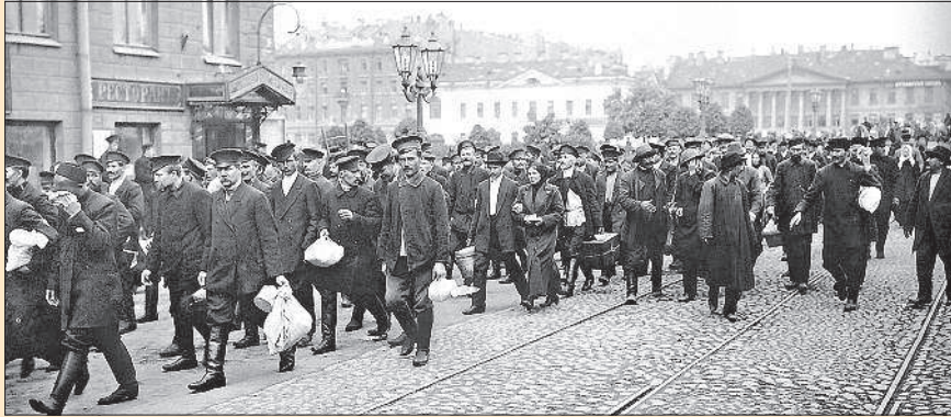
Мобилизованные на пути в казармы. Петроград. Август 1914 г.

На Северо-Западном фронте 4(17) августа 1-я русская армия (командующий – генерал П.К. Ренненкампф) вторглась в Восточную Пруссию. Через 3 дня перешла границу 2-я русская армия генерала А.В. Самсонова. К этому времени российская армия ещё не была полностью отмобилизованной и готовой вести крупномасштабные операции. В начале наступление русских армий в обход Мазурских озёр развивалось успешно. Уже через три дня 1-я армия нанесла тяжёлое поражение немцам под Гумбинненом (ныне г. Гусев). Однако русское командование неверно оценило ситуацию. Наступление было плохо подготовлено. Армия П.К. Ренненкампфа не стала преследовать отступающие немецкие войска, не развила свой успех. 2-й армии А.В. Самсонова пришлось наступать по трудным песчаным дорогам, в местности, бедной продовольствием. Германское командование, используя железные дороги, быстро произвело перегруппировку войск в Восточной Пруссии. В конце августа (по новому стилю), воспользовавшись отсутствием взаимодействия между двумя армиями, а также зная планы русского командования (германская разведка перехватила русские радиотелеграммы), германское командование обрушило все силы на армию А.В. Самсонова.