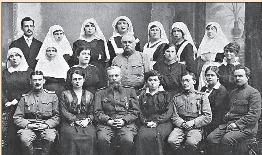
Сёстры милосердия, служащие и администрация одного из лазаретов Российского общества Красного Креста. 1916—1917 гг.