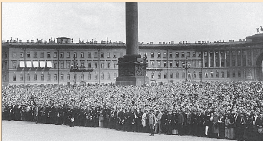
На Дворцовой площади в момент провозглашения Манифеста о вступлении в войну. Санкт-Петербург. 20 июля 1914 г.

достоинство, целость России и положение её среди великих держав».