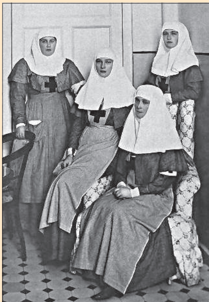
Сёстры милосердия — императрица Александра Фёдоровна, великие княжны Ольга Николаевна и Татьяна Николаевна. Слева — Анна Вырубова