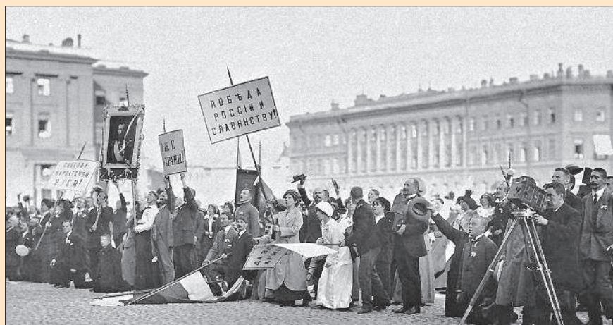
Толпа на Дворцовой площади Петербурга в ожидании объявления Манифеста о начале войны. 1914 г.

Германия мечтала о колониальных владениях, в том числе о западных землях России; Австро-Венгрия планировала захватить Сербию. Русский царь надеялся, что Россия присоединит Галицию и Северную Буковину, решит в свою пользу проблему проливов Босфор и Дарданеллы, будет и впредь контролировать ситуацию на Балканах.