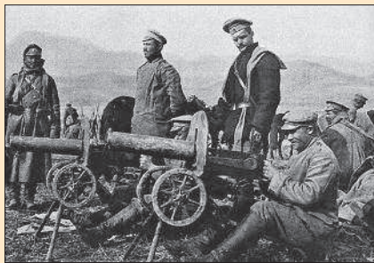
Кавказский фронт. Пулемётная команда

нодорожную станцию Сарыкамыш – главную тыловую базу русской армии. В боях, которые проходили в тяжёлых условиях гористой местности, русские войска под командованием генерала Н.Н. Юденича проявили чудеса выдержки, смекалки и отваги. Сарыкамышская операция окончилась полным разгромом турецкой армии. После этого поражения Османская империя так и не смогла восстановить свою полную боеспособность на этом фронте.